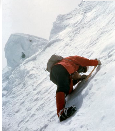
Schlußwand am Lhotse Shar

Ein Kapitel alpiner Geschichte, geprägt von Mut, Präzision und unerschütterlichem Willen.